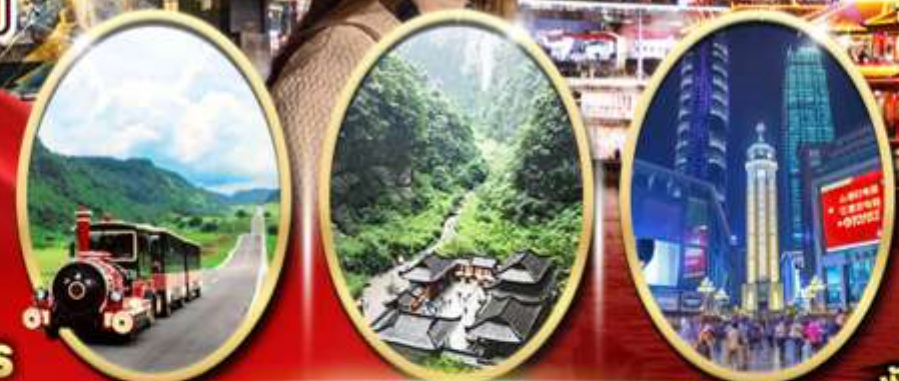
อุทยานเขานางฟ้า อุทยานหลุมฟ้า สะพานสวรรค์ ถนนคนเดินเจียฟางเป็ย

ไอโคนที่ พิเศษ! ✔ สุกกีหม่าล่า 1 มื้อ ✔ พักร่องแรม 4 ดาว 4 คืน ✔ ไอโคนที่ สุดว้าว! ✔ ขึ้นลิฟท์ชมวิวชมความ อลังการ ✔ กลางหุบเขา